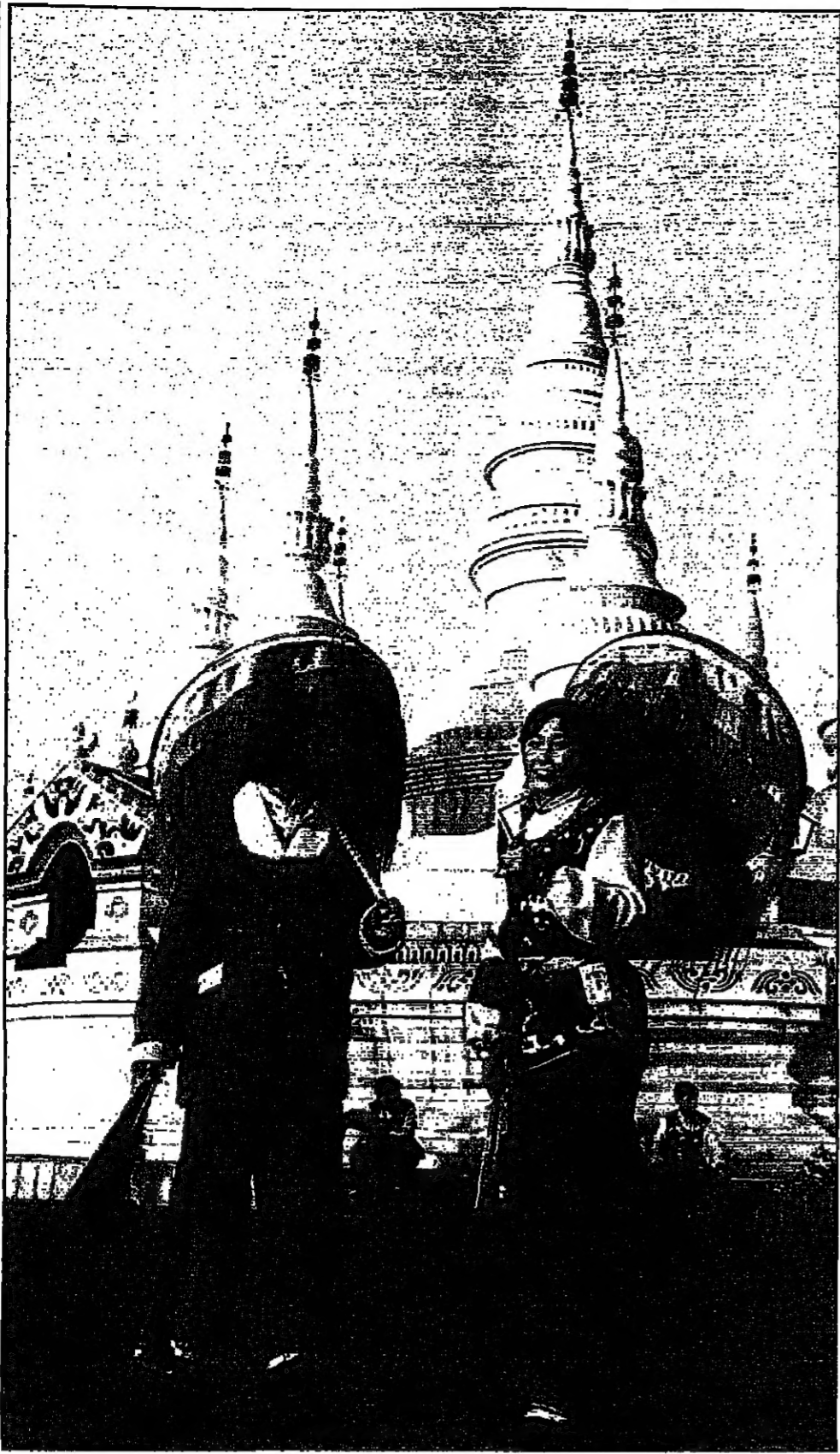
عزوتان في فريق الرقص الشعبي لغامطة هبيي الصينية تبادلتان الحديث في انتظار قدوم السياح قبل المشاركة في تقديم العرض الغنائي الرقص في الحديقة الثقافية بالعاصمة الصينية بكين